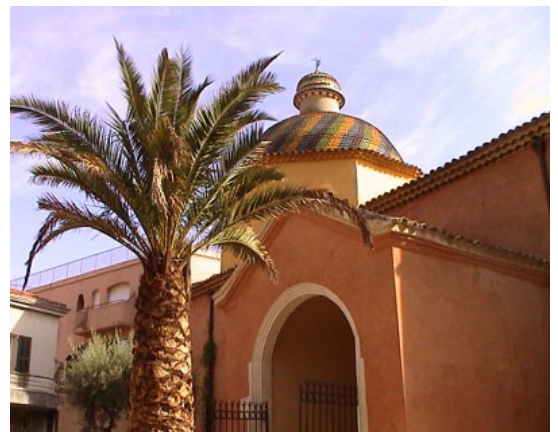
La Chapelle des Pénitents Blancs

L'édifice primitif comprenait une abside et une petite nef rectangulaire. Au XVIe siècle la confrérie de la Miséricorde s'installe, elle prendra le nom de Pénitents Blancs en 1560, elle avait un rôle humanitaire face à la pauvreté, la maladie et la mort. Au XVIIe siècle, le bâtiment est agrandi tel qu'il est de nos jours, on y ajoute une sacristie, une coupole ajourée de quatre fenêtres et un clocheton. L'originalité architecturale de cette chapelle réside dans son clocher : une remarquable coupole en tuiles polychromes. Restaurée en 1994, elle est aujourd'hui un lieu d'expositions temporaires dédiées aux arts plastiques.