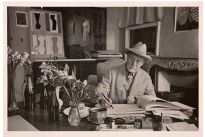
Henri Cartier-Bresson Henri Matisse à villa le Rève, 1944 - Photographie 18 x 12,5 cm Collection municipale – Ville de Vence © Henri Cartier-Bresson/Magnum photo.

« Il y a un dessin commun à toutes les choses, les plantes, les arbres, les animaux, les hommes, et c'est à ce dessin-là qu'il faut être accordé. »