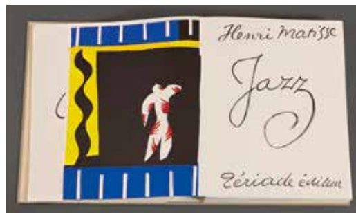
Jazz , 2004 Facsimilé d'après l'exemplaire n° 169 de l'édition originale du livre illustré d'Henri Matisse, Jazz , Editions Tériade, Paris, 1947 Sérigraphie. 41 x 31.5 cm Edition Anthèse, Paris, 2004 Collection municipale - Ville de Vence © Succession H. Matisse-Photo : François Fernandez.

Par-delà la peinture et le dessin, la création de la chapelle réalisée pour la congrégation des sœurs dominicaines du Rosaire de Vence, aboutissement de l'œuvre de Matisse, constitue de même un cheminement dans la couleur et la lumière. Cet espace tant matériel que spirituel ouvert aux pratiquants et aux visiteurs se veut, comme il en est de l'œuvre du peintre, source de bien être, souhaitant transcender l'individualité des cultures et des croyances vers une expression universelle faite d'une constante recherche, d'une genèse renouvelée : un voyage artistique sans fin auquel continueront à pouvoir s'associer les générations futures.