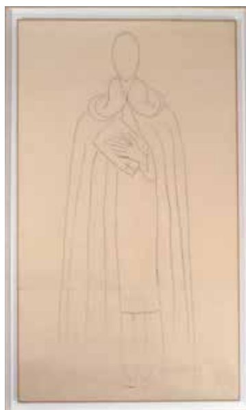
Henri Matisse Saint Dominique , 1950 Fusain sur papier - 194 x 123 cm Donation Maria-Gaetana Matisse, 2003 Collection municipale - Ville de Vence © Succession H. Matisse