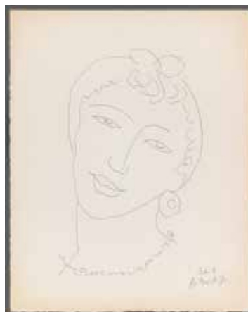
Henri Matisse Martiniquaise Étude pour le frontispice des Fleurs du mal de Baudelaire, Eau-forte - 25,2 x 19 cm Donation Barbara et Claude Duthuit, 2008 Collection municipale - Ville de Vence